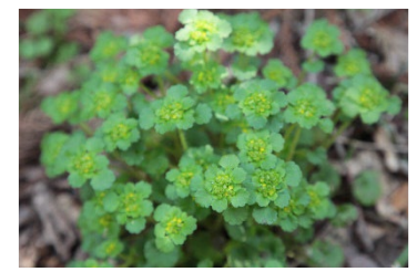
◆ヤマネコノメソウ

目の周りの白いアイリングが特徴的です。細いくちばしをつかい花の蜜を吸ったり、枝葉につかまり、葉の裏側に隠れている虫や木の実などを器用に探しては食べています。